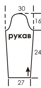
Схема 2. Обвязка.